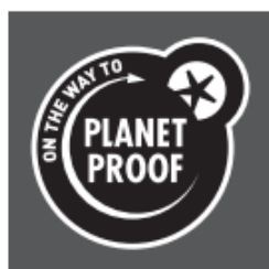
Zwart op donkere achtergrond