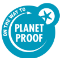
Petrolblauw op witte achtergrond

Gebruik bij voorkeur – zeker wanneer kleiner dan 20 mm breed – het originele, petrolblauwe logo op een witte ondergrond met witte omgeving.